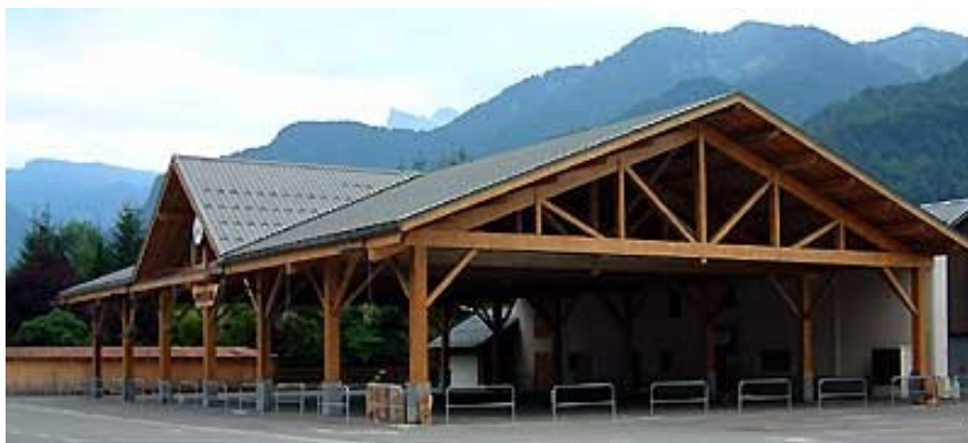
La halle, place du marché