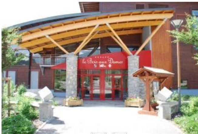
Le Centre culturel et sportif Bois aux Dames