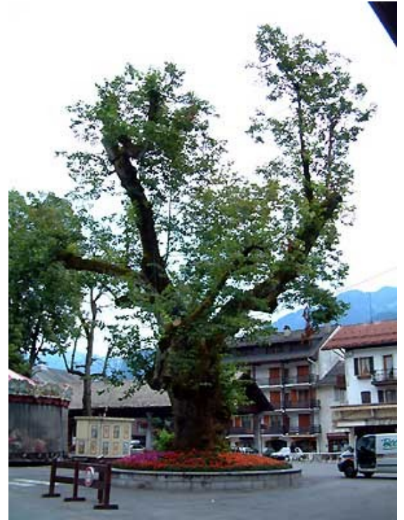
Le tilleul centenaire